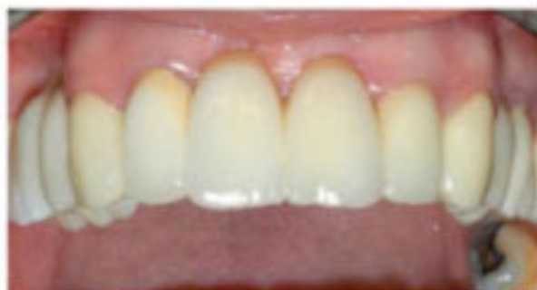
DOPO LA TERAPIA