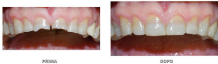
RICOSTRUZIONE FUNZIONALE ED ESTETICA DEGLI INCISIVI SUPERIORI CON OTTURAZIONI IN COMPOSITO

L'odontoiatria conservativa attuale consente con tecniche adesive di ricostruire denti molto compromessi