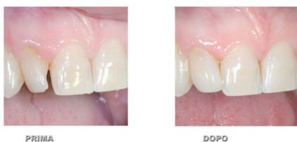
INESTETISMO DOVUTO A MALPOSIZIONE DI UN INCISIVO LATERALE RISOLTO CON UNA RICOSTRUZIONE IN COMPOSITO